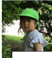
お散歩 in 開明が森