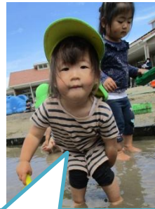
大きな水たまり きもちいいな★