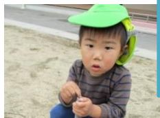
みてみて！ 泥んこ 触れたよ！