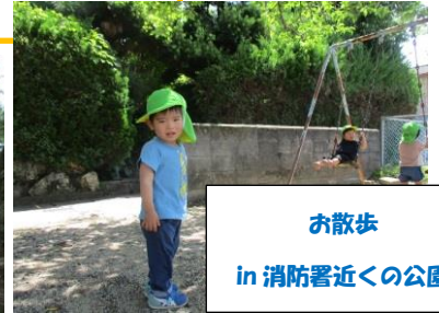
お散歩 in 消防署近くの公園