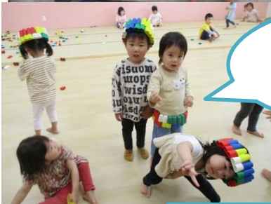
雨の日もお部屋で楽しく 遊んでるよ♪