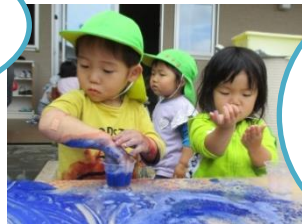
お姉さん達と 一緒に 絵の具あそび