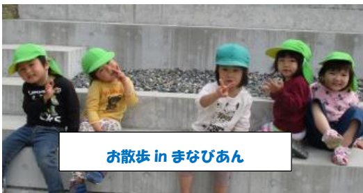
お散歩 in まなびあん