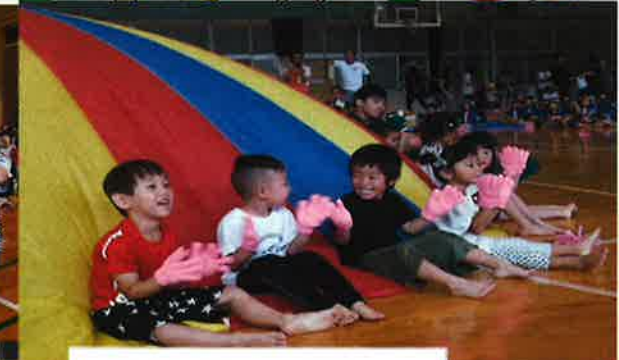
ご家族の協力に感謝!