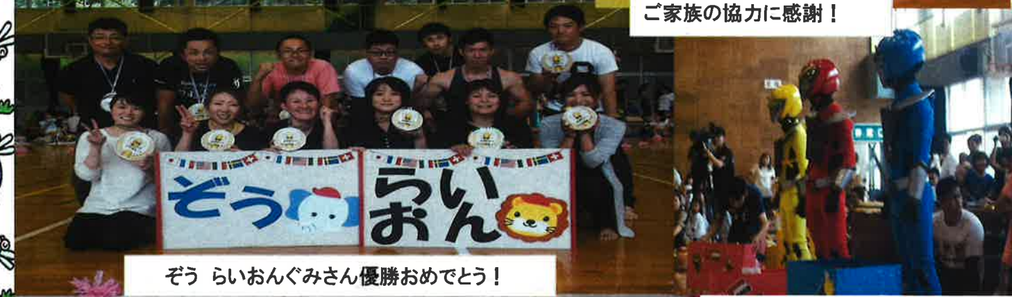
ぞう らいおんぐみさん優勝おめでとう!