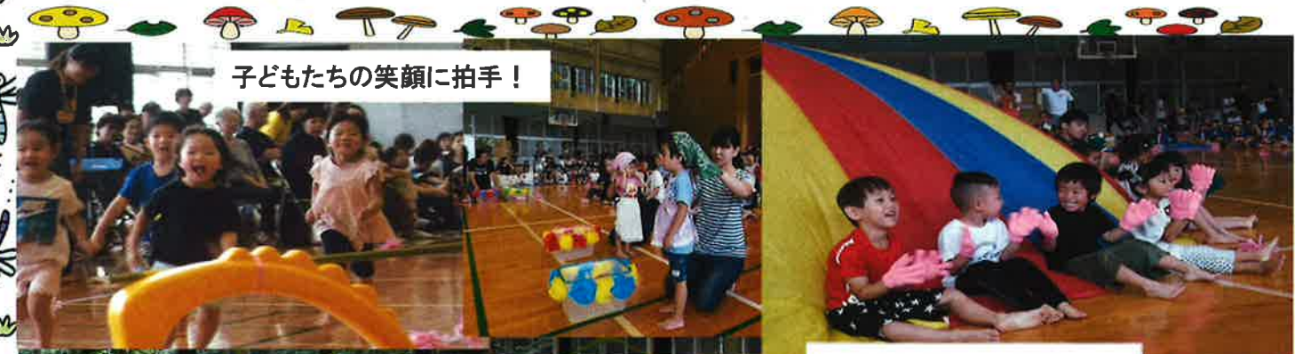
子どもたちの笑顔に拍手!