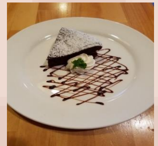
ガトーショコラ 200円