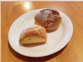
シュークリーム 100円