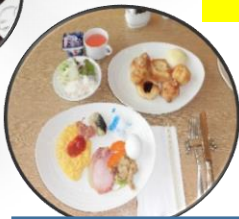
万座ビーチホテル 朝食ブッフェ