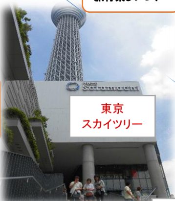
東京 スカイツリー