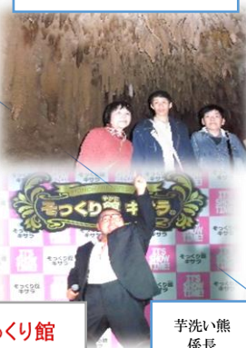
そっくり館 キサラ