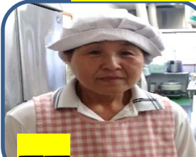
厨房 松下 よい子

年くってますが、ピカピカの一年生です。ゆっくり成長していけたら…と思っています。