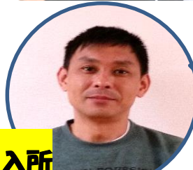
入所 いい のいかず 井 紀一

松葉寮から来ました。まだまだ、分からない事ばかりですが、皆さんに必要とされる看護職になりたいと思います。よろしくお願いいたします。