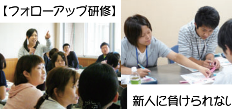
【フォローアップ研修】