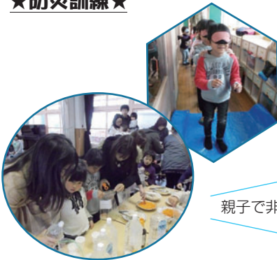
親子で非常食づくり！