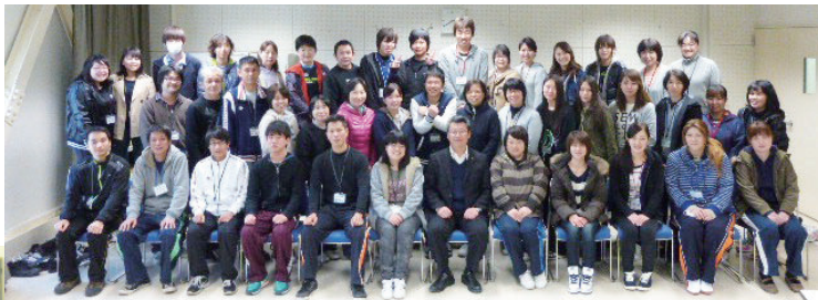
宿泊研修は青少年交流の家(大洲) 同時期に入職した仲間たちと絆を深めながら学ぶ。