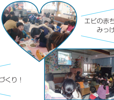
エビの赤ちゃん みつけ！