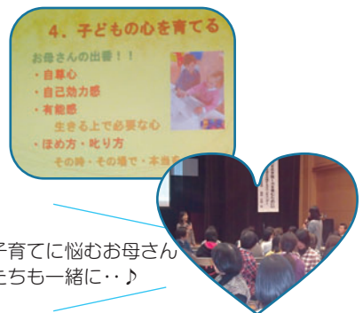
子育てに悩むお母さん たちも一緒に・・・♪